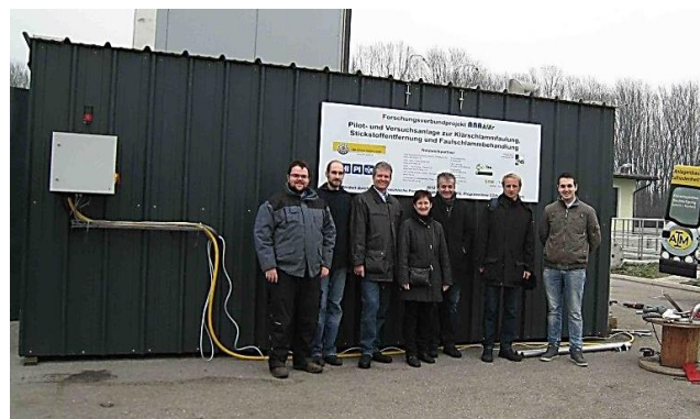
Pilotanlage am Standort Kläranlage Tulln (2012/13): Containeranlage mit 2 Faultürmen á 2 m 3 Volumen, Faulschlamm-Stripp-Anlage 1,5 bis 5 m 3 /h, 3 gerührte Schlammbehälter, manuelle Schlammpresse